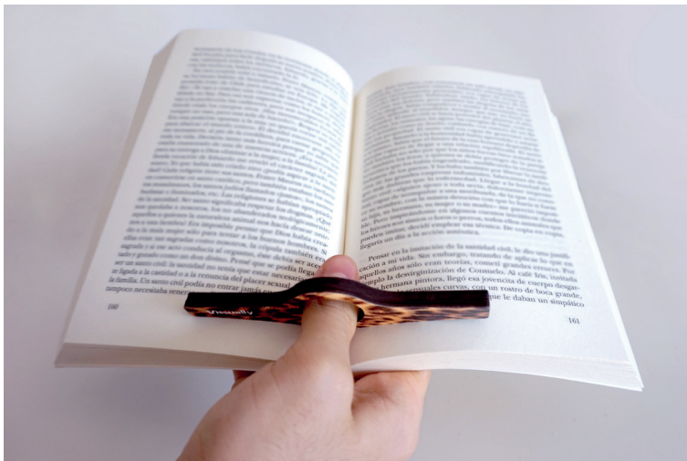
Abrepáginas de lectura una mano.